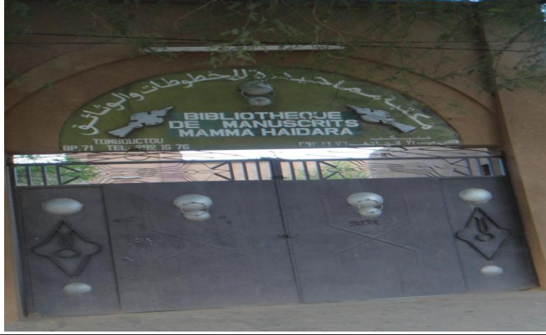
مكتبة ماما حيدرة للمخطوطات والوثائق* تمبكتو - مالي